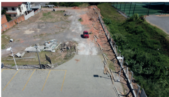
Vista aérea das telas sendo instaladas

Com a conclusão do projeto, a Apusm reforça sua infraestrutura e seu compromisso com um ambiente mais seguro e sustentável para os associados.