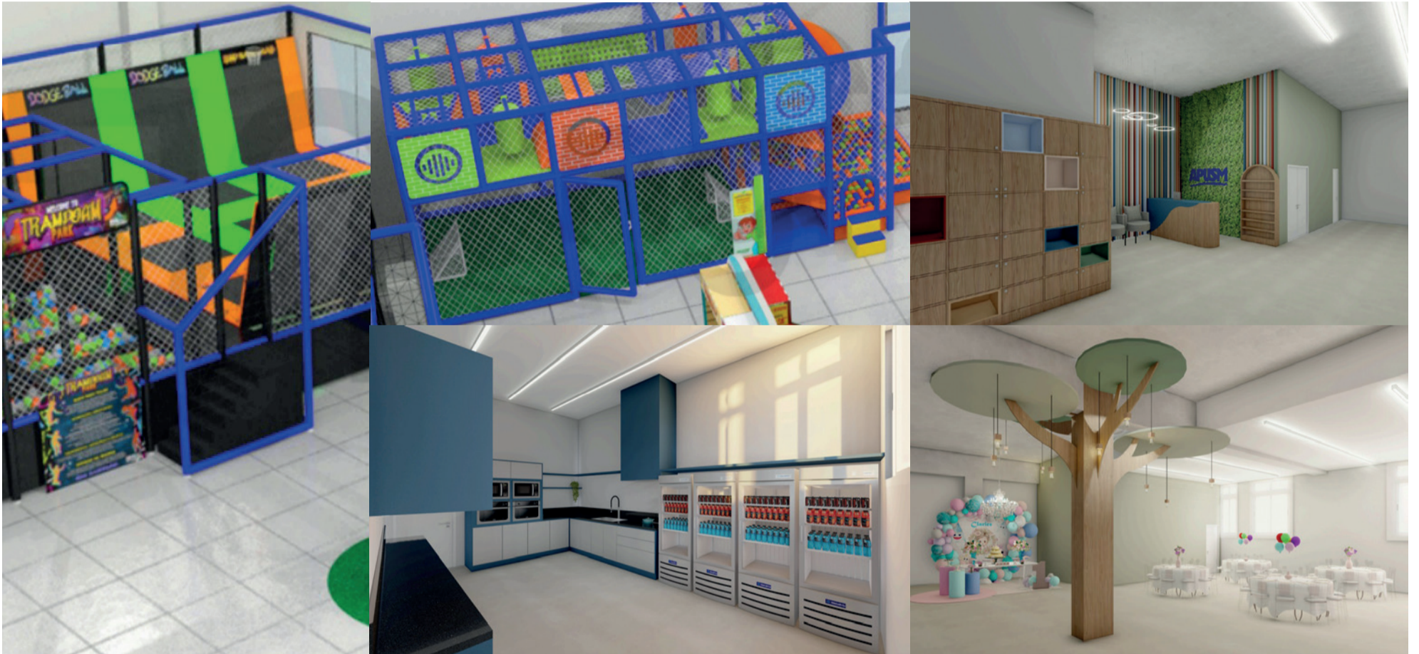
Projeto da Área Kids da Apusm

A Apusm está prestes a inaugurar um dos seus projetos mais aguardados: a Área Kids, um espaço exclusivo no Andar S1 projetado para oferecer lazer, segurança e estímulo ao desenvolvimento das crianças. Com uma estrutura moderna e pensada nos detalhes, o ambiente promete se tornar uma referência para as famílias associadas, combinando brincadeiras, aprendizado e conforto em um só lugar.