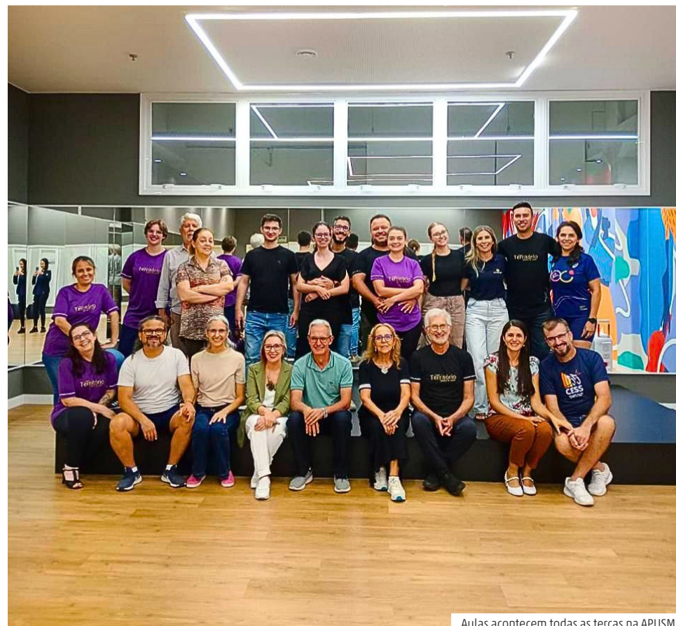
Aulas acontecem todas as terças na APUSM